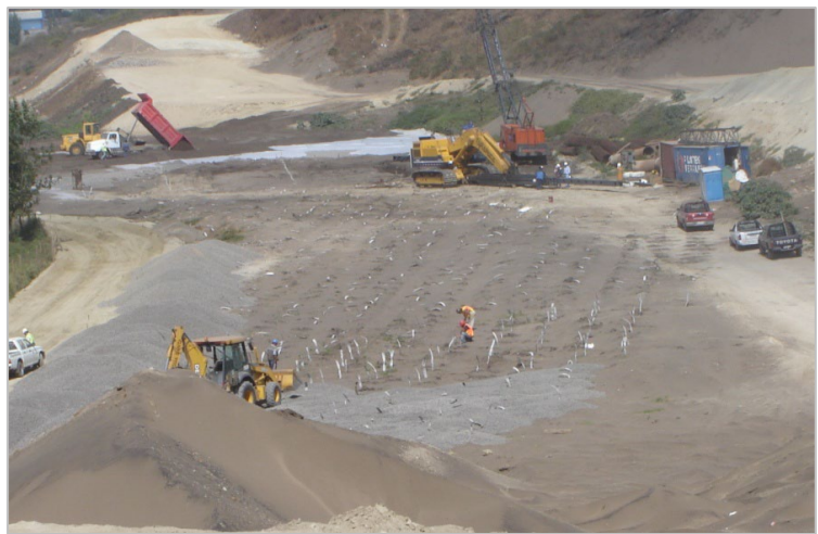
Imagen 4 – Vista general de área de consolidación.