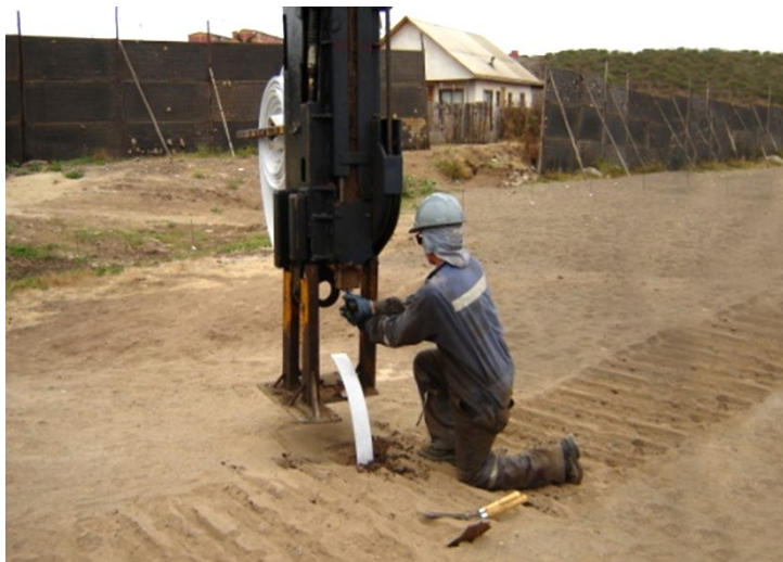
Imagen 1 – Instalación de Mechass Drenantes